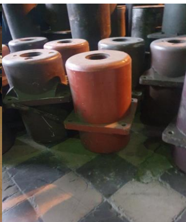
około 13 x 18kg