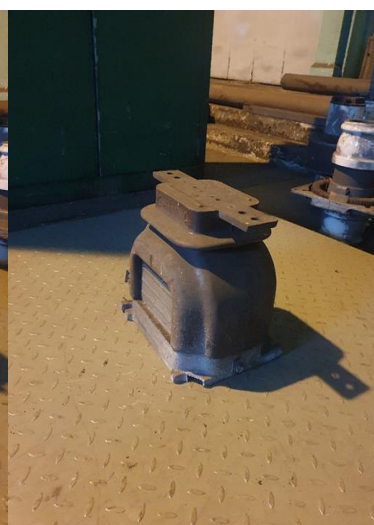
około 25 x 30kg