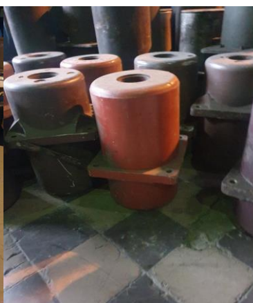
około 13 x 18kg