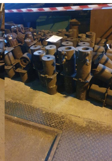
około 92 x 42kg

1. Sprzedający informuje, że okres obowiązywania cen wylicytowanych w przedmiotowej aukcji będzie obowiązywał od dnia zatwierdzenia ww. cen przez osoby uprawnione do reprezentowania Sprzedającego do dnia 30.04.2026r.