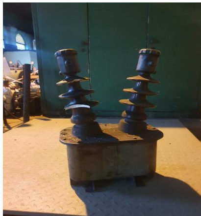
około 6 x 60kg